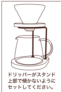
ドリッパーがスタンド上部で傾かないようにセットしてください。